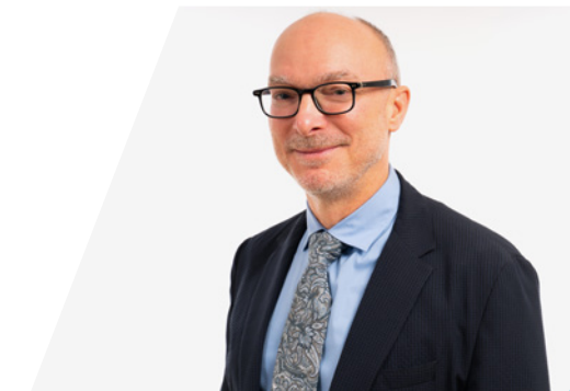
PIERRE CORRIVEAU, Président de l'OAQ

ASFQ est à pied d'œuvre sur le terrain pour relever ces défis. Son travail, qui permet de rehausser la qualité de vie des personnes les plus démunies et d'accroître la résilience de nos communautés, fait écho aux valeurs et aux préoccupations de l'Ordre des architectes du Québec. Notre profession doit se mobiliser pour bâtir des milieux de qualité, flexibles, adaptables et générateurs d'une plus grande équité sociale. À cet égard, l'action d'ASFQ et de toute son équipe est une formidable source d'inspiration pour les architectes.